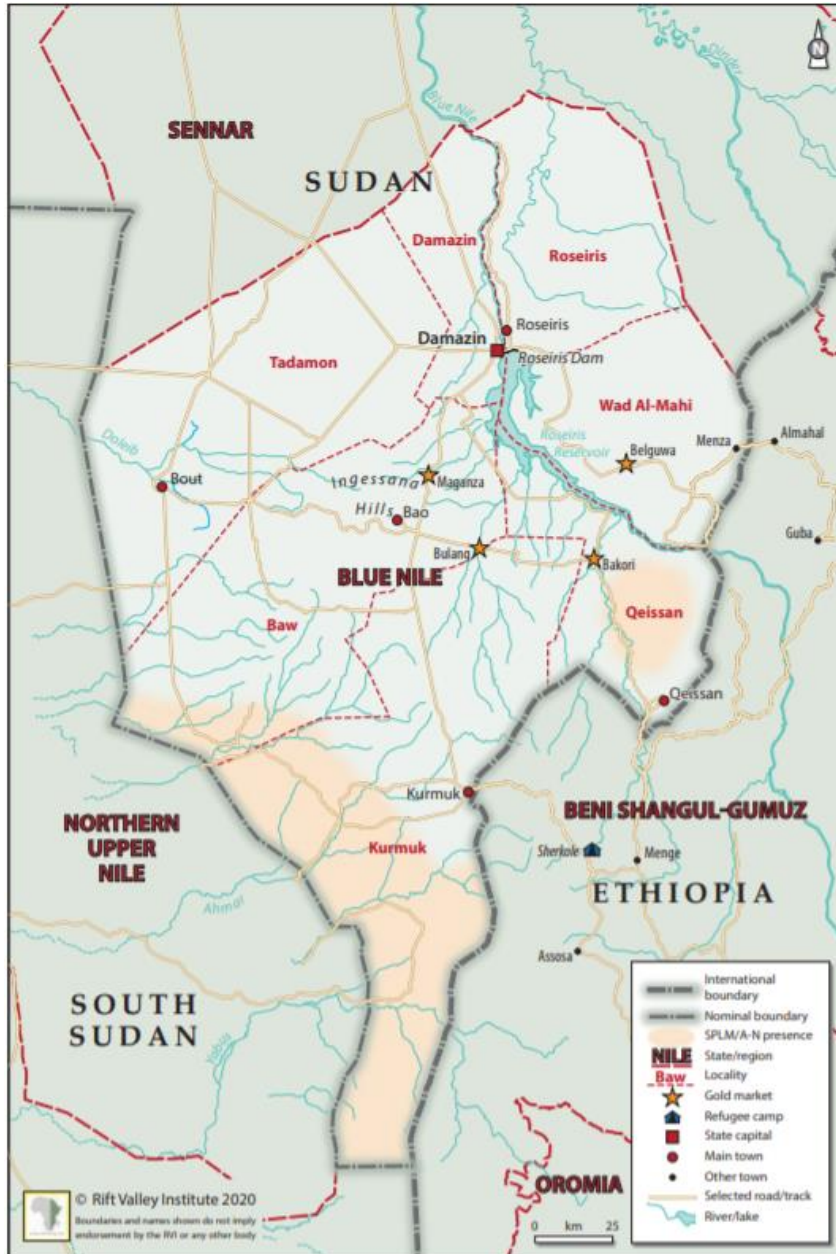
Bijlage 2: SPLM/A-N in Blauwe Nijl anno 2020 209