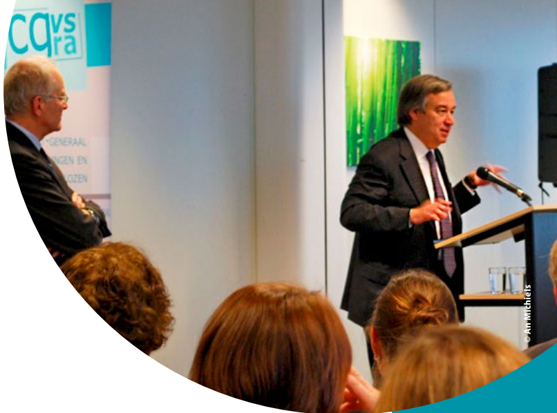
Foto: VN Hoog-Commissaris voor de Vluchtelingen, António Guterres spreekt tijdens een bezoek aan het CGVS de medewerkers toe. CGVS, Brussel, 2 februari 2010.